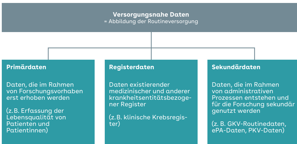
Abbildung 2 Versorgungsnahe Daten (VeDa) und ihre Quellen

VeDa bilden im Gegensatz zu experimentellen Studien unmittelbar die Versorgungspraxis ab. In ihrem Rahmen lassen sich auch neue experimentelle (komplexe) Interventionen durchführen.